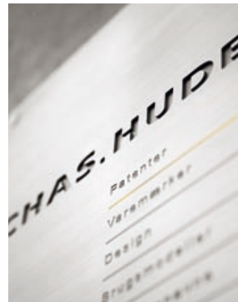
Chas. Hude blev grundlagt i 1896 af Charles von der Hude, altid kaldet Chas.